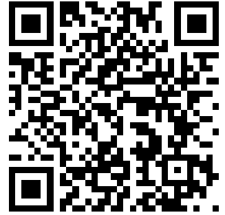
ABB - ABB MOD.I-MAG-SCH.2NO CONTACT